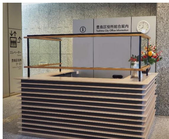
寄贈されたウイルスクリーン®を使用した受付