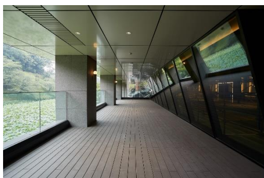
九段会館テラス設置の様子（1階テラス部分）

今回、日本のオフィスビルへの初めての本格導入となった九段会館テラスでは、1階のオフィスエントランスや、各エリアへの結節点となるプラザ、地下1階の外装面に複層ガラスとして設置されています。建物屋上に設置したセンサーなどの各種データや AI を利用し、ガラスの透過率を自動調整して、室内に差し込む自然光・熱量を日中にわたり最適化しています。これによりブラインド等の日除けを使わずに皇居外苑緑地が望める眺望を確保しながら、空調や照明によるエネルギー消費量の削減を可能にしています。