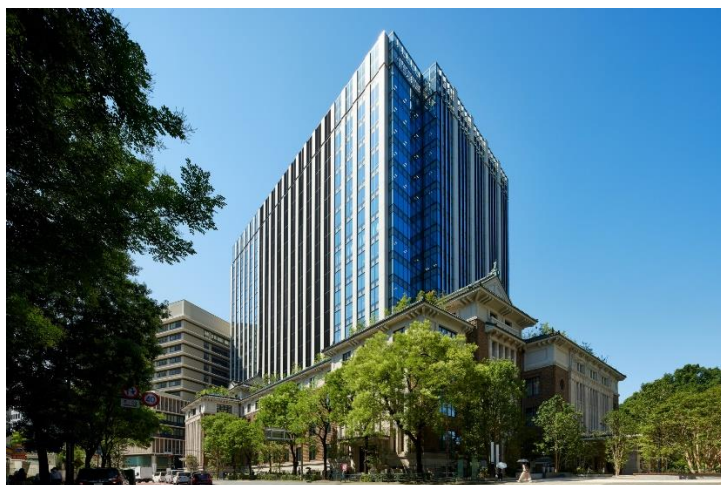
竣工した九段会館テラス

https://www.kajima.co.jp/news/press/202209/pdf/8a1-j.pdf