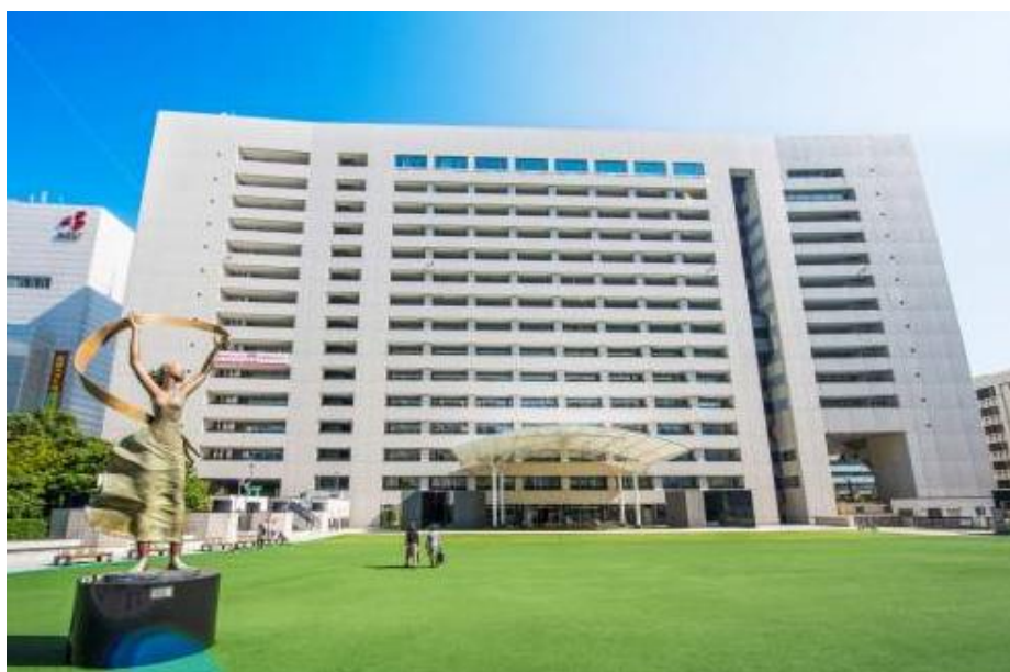
福岡市役所 外観写真

当社は、市場ニーズに合致したValue Added製品（VA品）を、今後も積極的に展開し、「VAガラスカンパニー」となることを目指します。